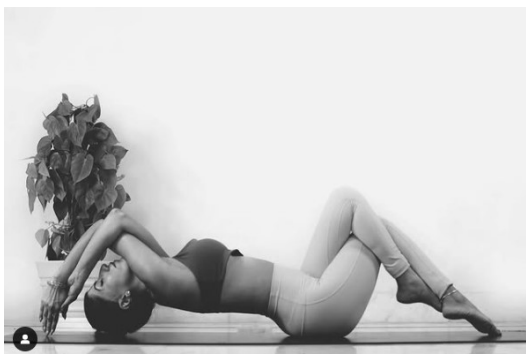
Garudasana de diferentes maneras