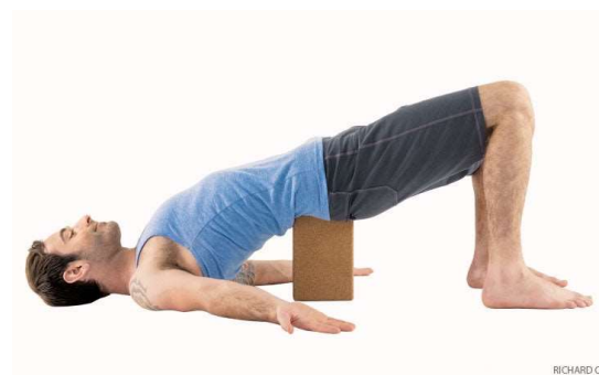
El puente sobre apoyo