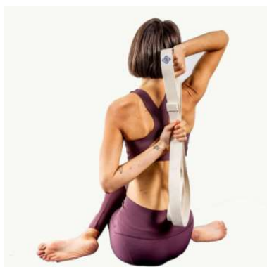
Cara de vaca con cinta