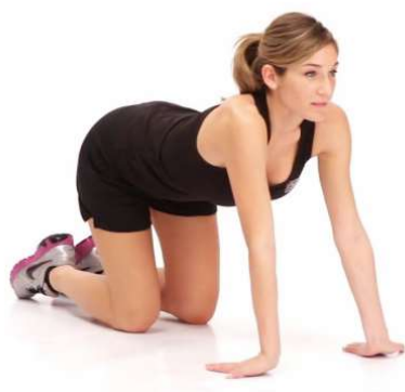
Estiramiento de flexores de rodillas