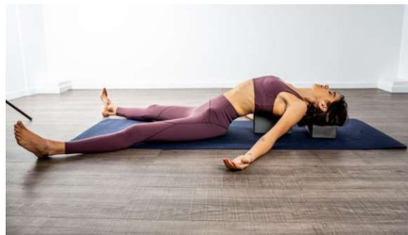
El pez con apoyos