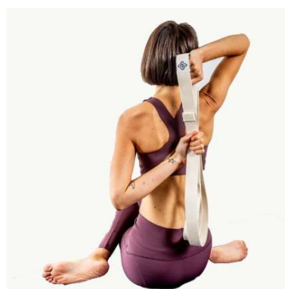
Cara de vaca con cinta