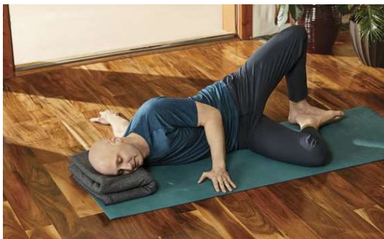
El ala abierta