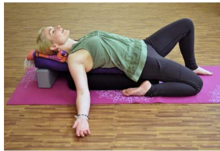
El héroe (ekapada supta virasana)