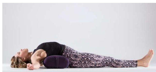
Tumbadas con taco en el sacro