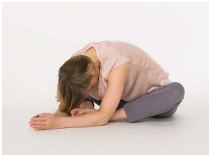
La mariposa en flexion