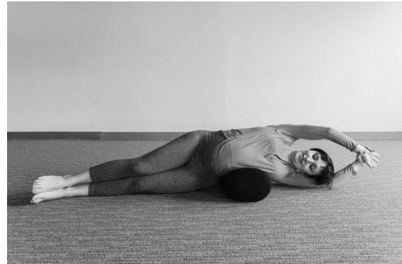
El plátano vertical