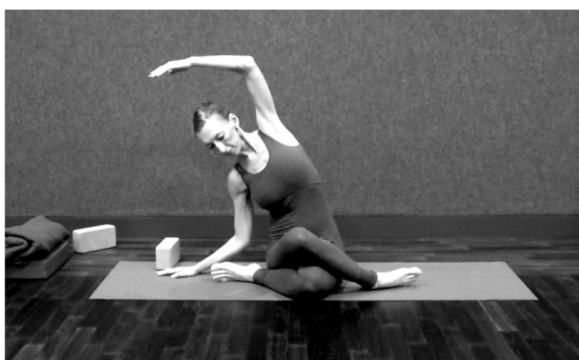
El lazo en inclinación