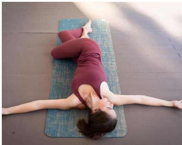
Torsion tumbado piernas enlazadas