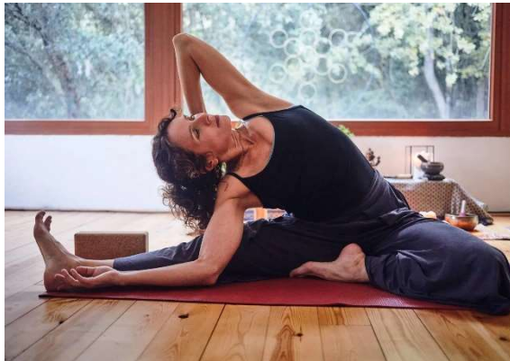
Baddha Konasana (La mariposa)