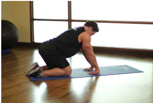
Apertura de manos