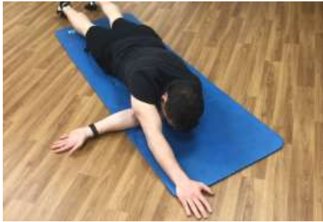
Postura del ala cerrada